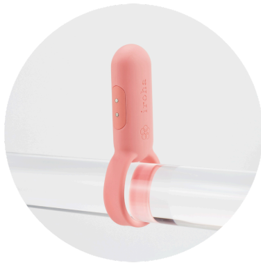
Länglicher Vibrationskörper für gezielte klitorale Stimulation