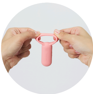
Dehnbarer Silikonring, passend für die meisten Penisgrößen