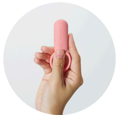
In der Hand haltbar für punktgenaue Stimulation