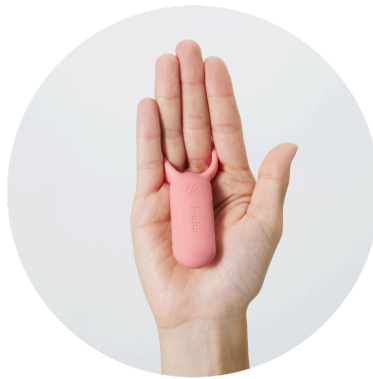
An den Fingern tragbar für stimulierende Berührungen